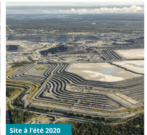
Site à l'été 2020