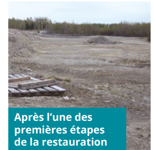
Après l'une des premières étapes de la restauration