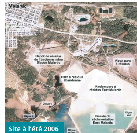
Site à l'été 2006