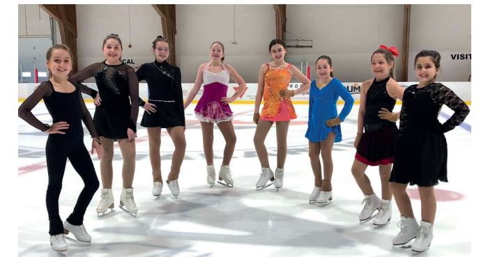
prise en février dernier.

Le FECM contribue un montant de 2 500 $ au Club de patinage artistique de Malartic pour l'achat d'un tissu durable afin de couvrir le tour de bande lors de spectacles présentés à l'aréna du Centre Michel-Brière. Il remplace les rouleaux de plastique à utilisation unique.