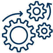
Production en continu