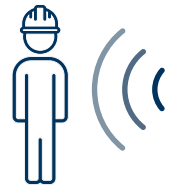
Système de détection des piétons