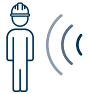
Systèmes de détection et de localisation des travailleurs