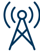
Communication par réseau mobile LTE